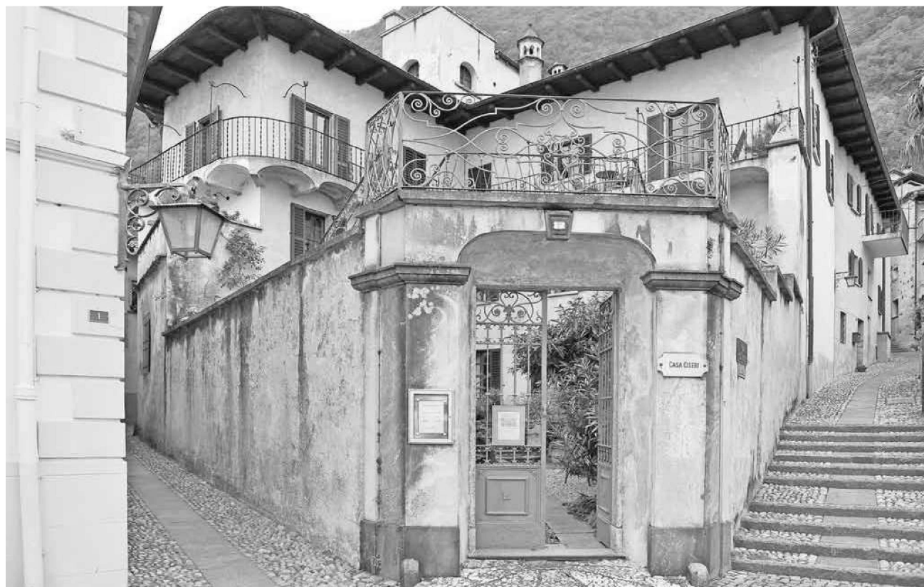
Casa Ciseri a Ronco sopra Ascona.